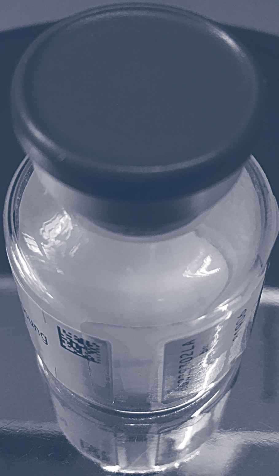
Fertigarzneimittel (FAM) auf Spektrometer